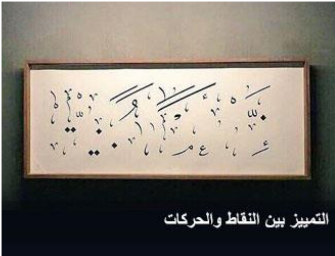
التمييز بين النقاط والحركات

أحسنتم جميعاً بآرك الله فيكم، جزاكم الله خيراً، بالفعل إخواننا المغاربة في مصاحفهم يميزون بين القاف والفاء بأن الفاء توضع تحتها نقطة أما القاف فتوضع فوقها نقطةً واحدةً هذا في مصاحف إخواننا المغاربة.