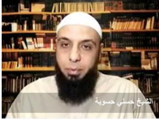
الشيخ حسني حسوبة

الإمام الكسائي رحمه الله وهو أحد تلامذة الخليل بن أحمد، الإمام الكسائي رحمه الله لما توفي رُئي في المنام، رآه أحد تلاميذه وطبعاً الرؤى والأحلام والمنامات لا يُبنى عليها حكمٌ شرعي، وكرامات ورؤى الأولياء كما علّمنا مشايخنا لا تُصدّق ولا تُكذّب ولكن إن لم يكن القدر والرفعة والمكانة لأهل القرآن فلمن تكون؟!!